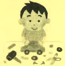
工作コーナー クラフトバッグ作り等