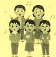
歌やダンスの発表

オリジナル石鹼、クラフトバッグ作りや、はまちゃんやまちゃんによる大型紙芝居、歌や踊りの発表会などを行います。かつら工房やつくしのパンなどの販売も行います。