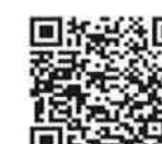
横浜市原宿地域ケアプラザ